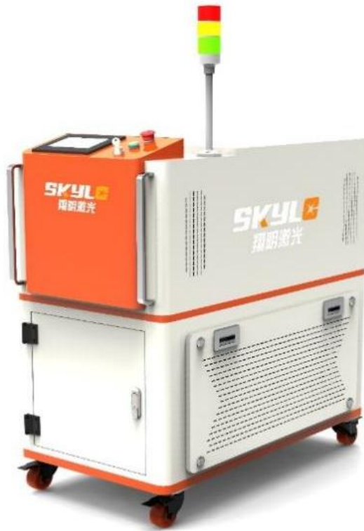
图 1 CW-H-1500W 外观图（产品以实际交付为准）