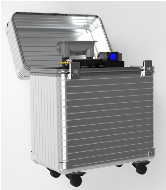
带便携式行李箱图(选配)