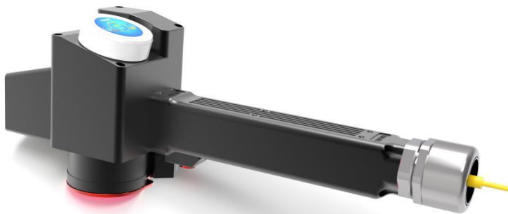
图 2 清洗头